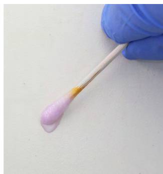
Roze = lage concentratie chroom-6