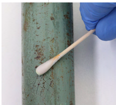
Wit = geen chroom-6