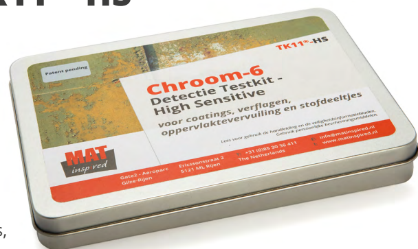
High Sensitive Chroom-6 test op verflagen

Deze testkit is extra gevoelig voor lage concentraties chroom-6. De testkit bevat 25 teststaven en wordt geleverd met een Nederlandse handleiding en veiligheidsinformatiebladen.